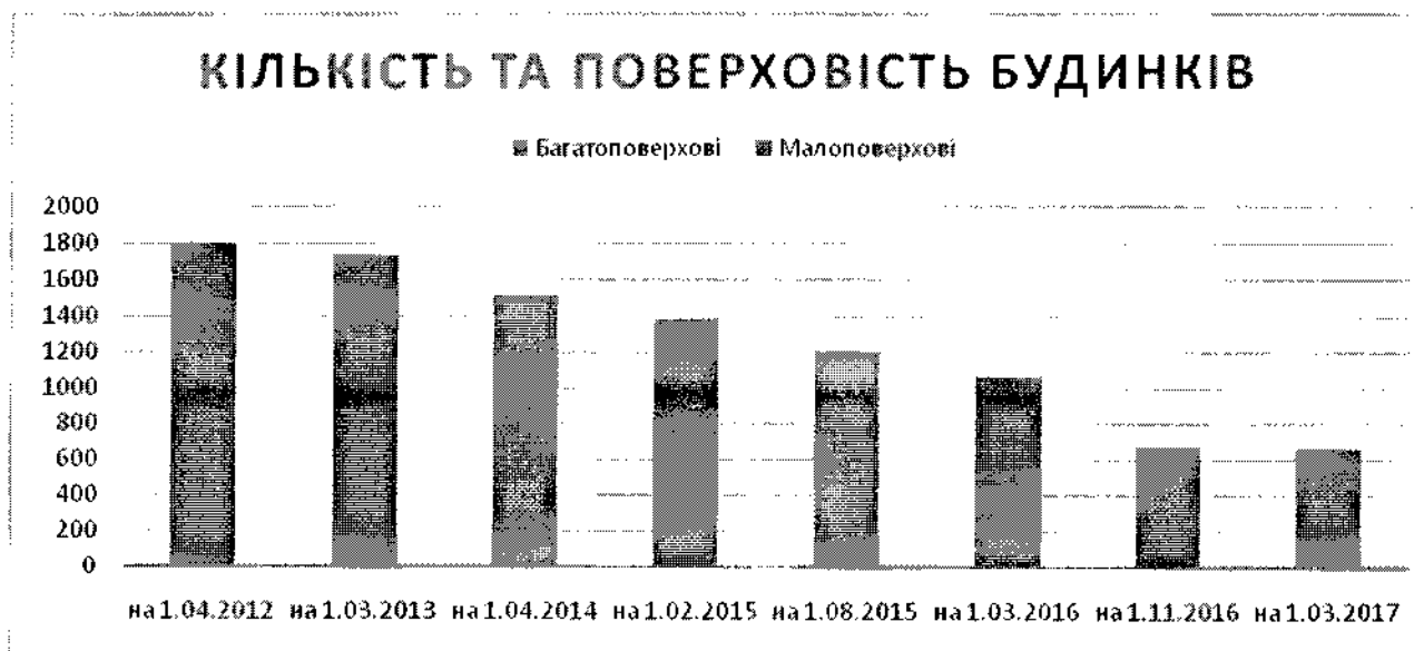
Кількість будинків, які перебувають в управлінні КП «Муніципальна інвестиційна управляюча компанія», та їх поверховість

Середній вік будинку, що перебуває на балансі КП «МІУК» – 40 років (у 2015 році – 51 рік, у 2014 році – 53 роки). З новобудов в управлінні підприємства один будинок 2011 року, два – 2013 року та один – 2015 року будови.